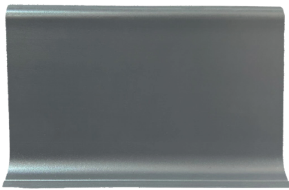
ZÓCALO DE PVC LISO RÍGIDO GRIS OSCURO 100mm x 3.5mm x 3ml