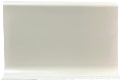
ZÓCALO DE PVC LISO RÍGIDO BEIGE 100mm x 3.5mm x 3ml