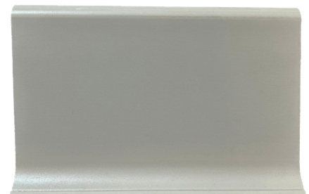
ZÓCALO DE PVC LISO RÍGIDO GRIS 100mm x 3.5mm x 3ml