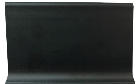
ZÓCALO DE PVC LISO RÍGIDO NEGRO 100mm x 3.5mm x 3ml