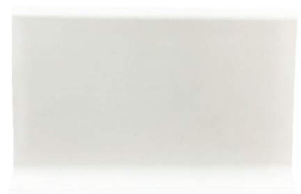
ZÓCALO DE PVC LISO RÍGIDO BLANCO 100mm x 3.5mm x 3ml