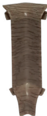
ESQUINERO INTERIOR CODIGO: 900102 COLOR: PF04, PF05-2, PF8017-1, PF17, PF8003-7, PF1027-5, PF1002-15, PF8065-5, PF8091-3