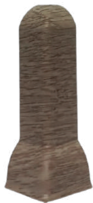
ESQUINERO EXTERIOR CODIGO: 900101 COLOR: PF04, PF05-2, PF8017-1, PF17, PF8003-7, PF1027-5, PF1002-15, PF8065-5, PF8091-3